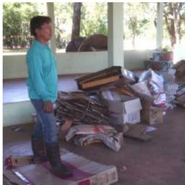
กระดาษ/กล่อง/ลัง