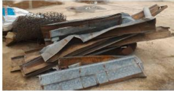
โลหะ/สังกะสีเก่า