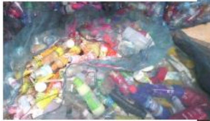
ขวดน้ำพลาสติก