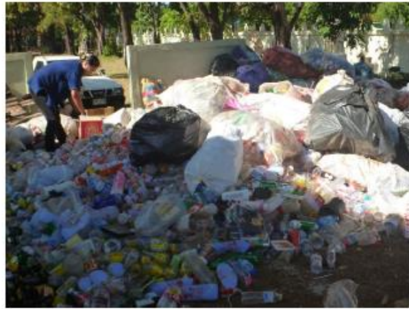
ถุงพลาสติก/ถุงหิ้วใส่ของ/กล่องเครื่องดื่ม