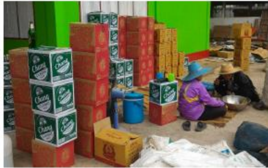
ขวดเครื่องดื่ม/เหล้า/เบียร์