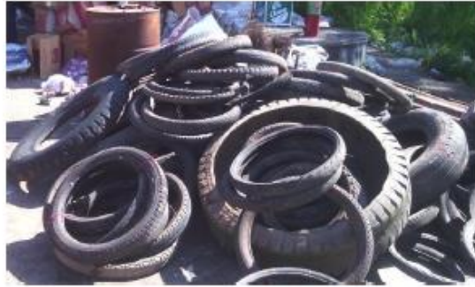
ยางนอกรถทุกชนิด

วัสดุเหลือใช้หรือที่ใช้แล้วเหล่านี้ จะถูกเรียกว่าขยะเมื่อเราทิ้งลงถัง แต่จะกลับมามีมูลค่าเมื่อเราแยกเก็บ