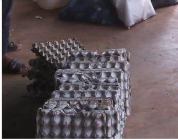
ภาชนะกระดาษใส่ไข่ไก่

วัสดุเหลือใช้หรือที่ใช้แล้วเหล่านี้ จะถูกเรียกว่าขยะเมื่อเราทิ้งลงถัง แต่จะกลับมามีมูลค่าเมื่อเราแยกเก็บ