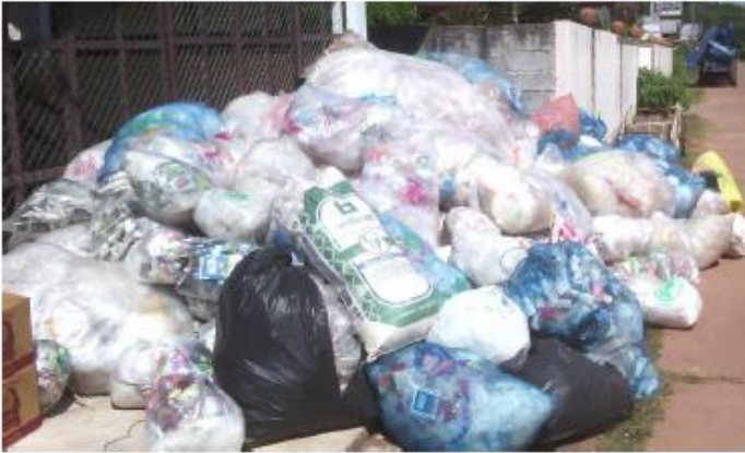
ถุงพลาสติก กล่องเครื่องดื่ม

วัสดุเหลือใช้หรือที่ใช่แล้วเหล่านี้ จะถูกเรียกว่าขยะเมื่อเราทิ้งลงถัง แต่จะกลับมามีมูลค่าเมื่อเราแยกเก็บ